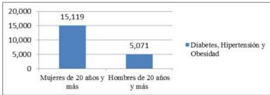
Distribución de la Población por Sexo